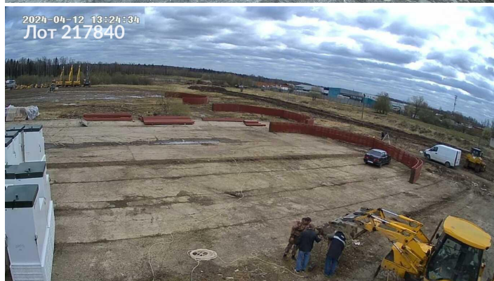
2024-04-12 13:24:34 Лот 217840